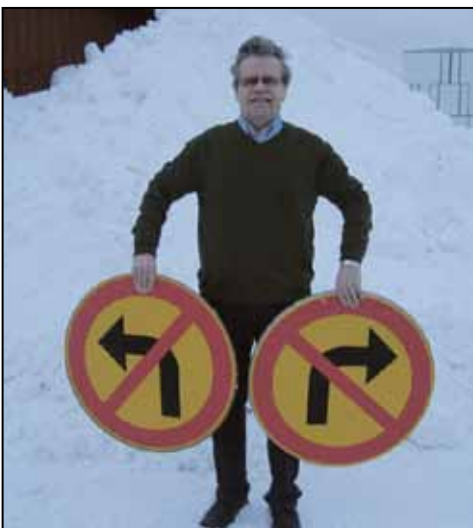
Kake näyttää, että Perussuomalaiset eivät ole poliittisesti vasemmalla eikä oikealla, vaan pääsääntöisesti oikeassa ja askeleen edellä muita puolueita.

Suomen etu on pitkällä tähtäyksellä irrottautua EU:sta ja talous- ja rahaliitto EMU:sta, sillä kuten Norja on pärjännyt EU:n ja Ruotsi EMU:n ulkopuolella, myös Suomi tulisi toimeen ilman kumpaakaan jäsenyyttä. Nyky-muotoinen EU ja rahaliitto EMU seisovat sa-vijaloilla.