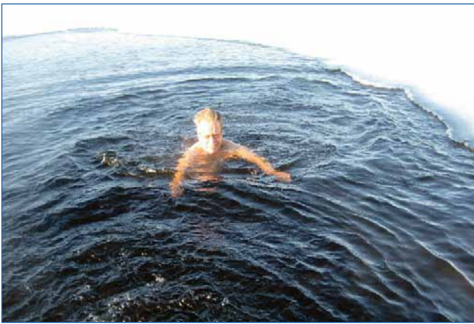
Kake on harrastanut avantouintia reilut kymmenen vuotta. Hän toimi vuosina 2002–2006 Suomen Avantouinti ry:n ensimmäisenä puheenjohtajana.