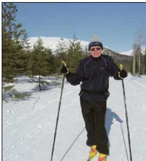
Kake harrastaa perinteistä hiihtoa, kun polvivamma estää luistelutyylin.