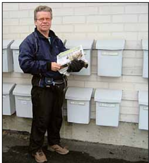
Kake jakaa Perussuomalainen-lehteä kolmen viikon välein eri puolille Kuokkalaa.