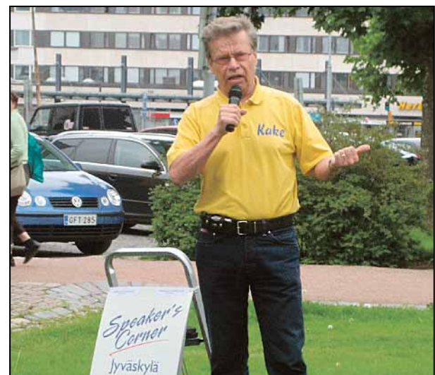
Kake puhumassa Jyväskylän Speaker's Cornerin puhetilaisuudessa Kirkkopuistossa. Aiheena "Miksi PS oli EU-vaalien voittaja ja miksi vasemmisto hävisi?".

JY Jyväskylän revisio- ja investortoimisto Oy